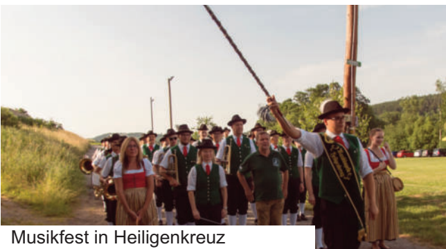
Musikfest in Heiligenkreuz

Der Höhepunkt dieses Jahres war unser Musikfest im Juni. Am Samstag fand das traditionelle Heiligenkreuzertreffen in einem Festzelt am Sportplatz statt, bei dem wir unsere Freunde aus Heiligenkreuz im Burgenland, der Steiermark und Kroatien begrüßen durften. Am Sonntag feierten wir dann unseren 70sten Geburtstag. Dazu waren auch alle ehemaligen Mitglieder unseres Vereins eingeladen – viele sind der Einladung gefolgt und so gab es viele persönliche Wiedersehen. Zu unserem 70jährigen Bestandsjubiläum haben wir eine Festschrift herausgebracht. Diese kann bei den Mitgliedern der Musikkapelle und auf dem Gemeindeamt erworben werden.