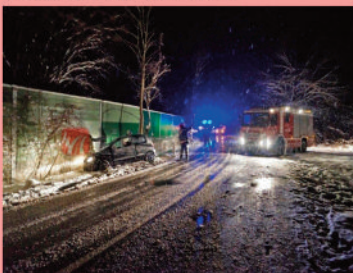
Fahrzeugbergung auf der L130 bei Schneetreiben