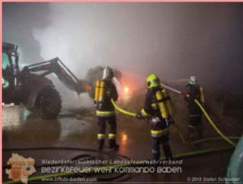
Brand von ca. 350 Strohballen in Untermaierhof