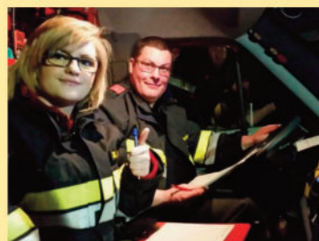
Übung: Aufgaben des Feuerwehrfunktlers in der Einsatzleitung

Mehr Infos u. Fotos unter: www.ff-heiligenkreuz.at