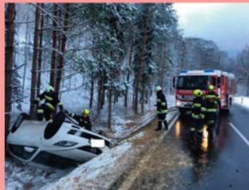
PKW-Überschlag B 210