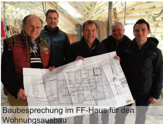
Baubesprechung im FF-Haus für den Wohnungsausbau

Beim Wohnungs- und Feuerwehrhausbau sind wir sehr gut im Zeit- und Kostenplan unterwegs. In den nächsten Wochen wird der Übergang vom Musikhaus (gemeinsames Stiegenhaus) von der Schlosserei Rankl montiert.