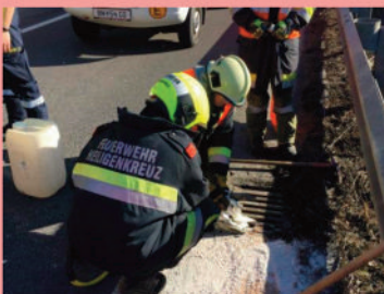
Schadstoffeinsatz nach Dieselaustritt auf der A21