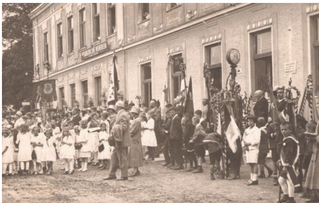
Fronleichnam ca. 1930

Die Heiligenkreuzer Topothek hat schon über 1.300 Objekte online! Viele Menschen sind schon davon fasziniert; wer sie noch nicht kennt, kann jederzeit reinschauen. Auf heiligenkreuz.topothek.at sind Hunderte von Photos aus dem Leben der Gemeinde und des Klosters zu sehen.